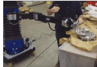
Manipulation de meules outil manuel