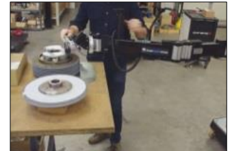
Manipulation de meules outil commandé