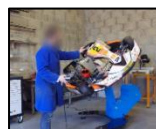
Démonstration en vidéo