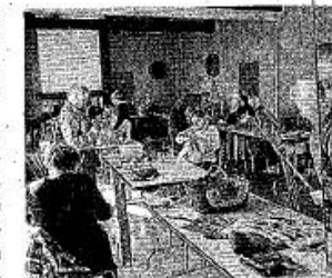
Les vanniers amateurs du département se rencontreront à l'Espèce Sévria les 24 et 25 février prochains afin d'y présenter leurs œuvres.

Samedi 24 février , de 14 h à 18 h et dimanche 25 février , de 10 h à 18 h, espace Sévria. Entrée gratuite.