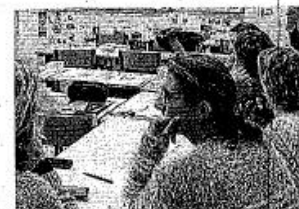
Le conseil d'établissement a validé la candidature de l'école Sainte-Marie à un label international d'ouverture aux langues étrangères, dès la maternelle.

« Un groupe de pilotage avec les enseignants est constitué. Son